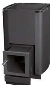
KARHU-12 (16, 20, 27, 37) JK