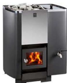
KARHU-12 (20, 27, 37) VO