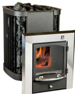
SAGA-20 (27) KSIL