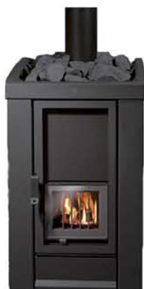
INCENDO-20 (27) TS1