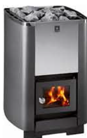
KARHU-12 (16, 20, 27, 37)