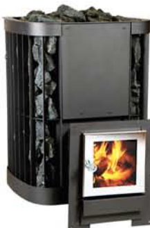
SAGA-20 (27) JK