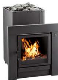
KSIS-20 (27, 37)

TS – без кожуха TS1 – большая стеклянная дверца VO – водяной бак справа VV – водяной бак слева